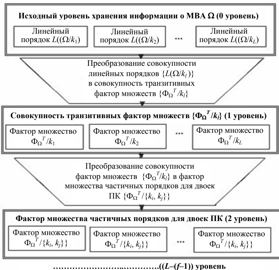
Рис. 2. Укрупненная блок-схема многоуровневого критериального структурирования альтернатив для справочных систем САПР

На 1 уровне осуществляется хранение совокупности окрестностей транзитивных фактор-множеств \{\Phi_{\Omega}^T/k_i\} по отдельным ПК МВА.