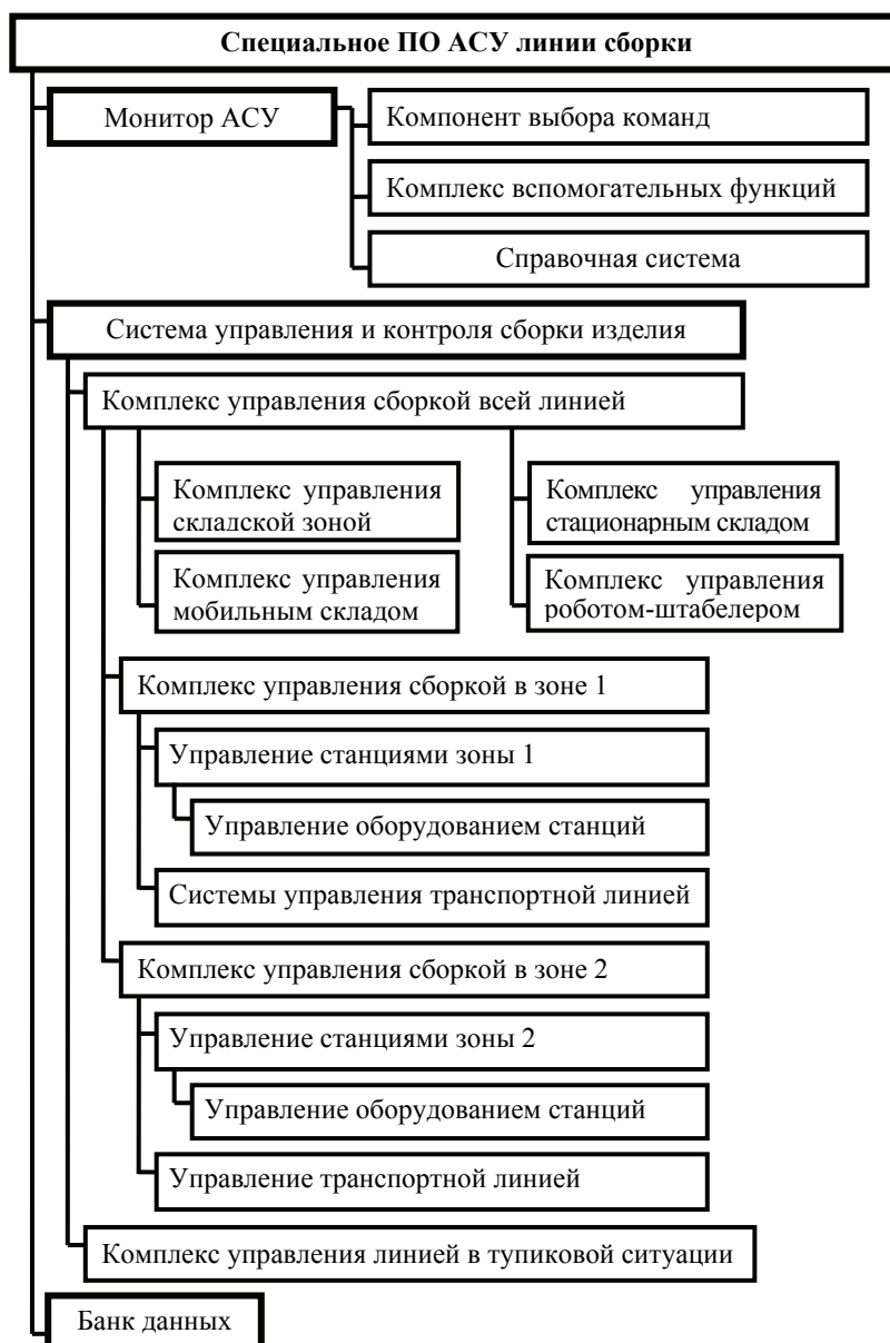
Рис. 2. ПО АСУ ТС