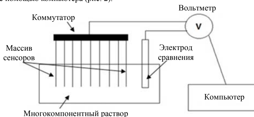
Рис. 2. Измерительная схема мультисенсорной системы на основе потенциометрических химических сенсоров

аналитического сигнала. Измерения с массивом мультисенсорной системы, состоящим из таких сенсоров, в целом аналогичны таковым с отдельными электродами: измеряется ЭДС электрохимической ячейки, состоящей из массива сенсоров и электрода сравнения. Для измерений используют многоканальные вольтметры с высоким входным импедансом (более 10^{12} Ом). Управление измерениями и запись данных осуществляется с помощью компьютера (рис. 2).