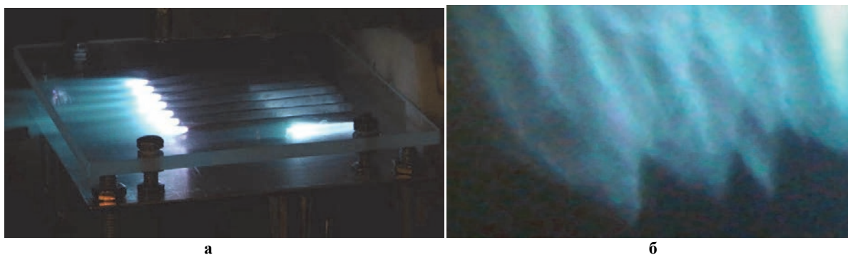
Рис. 2. Устойчивое горение пропана в сверхзвуковом потоке (а). Фронт горения (б) совпадает с линиями распространения возмущений в сверхзвуковом потоке с M=2 . Расстояние между электромагнитными вибраторами на фрагменте (а) и конусами горения (б) 50 мм