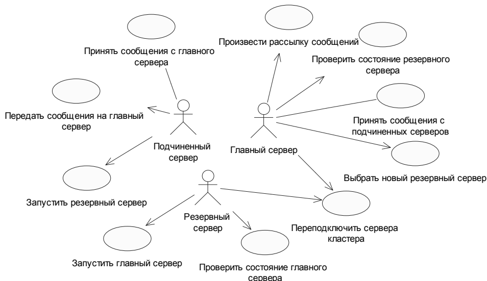
Рис. 1. Диаграмма вариантов использования системы

Для реализации описанной выше архитектуры необходимо создать модуль брокера, предоставляющий определенный функционал в зависимости от ролей узла в кластере (рис. 1).